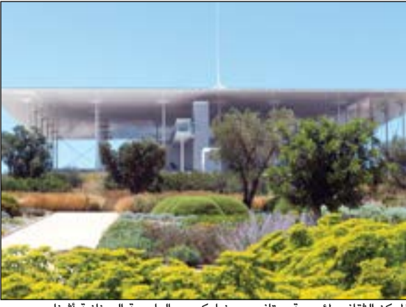
المركز الثقافي المؤسسة ستافروس نياركوس بالعاصمة اليونانية أثينا