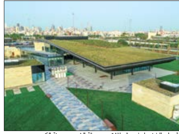
الأسطح الخضراء في مقر المؤتمر بحديقة الشهيد بمدينة الكويت