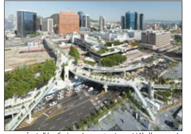
مشروع سويلو لتخضير جزء من جسر رئيسي في كوريا الجنوبية