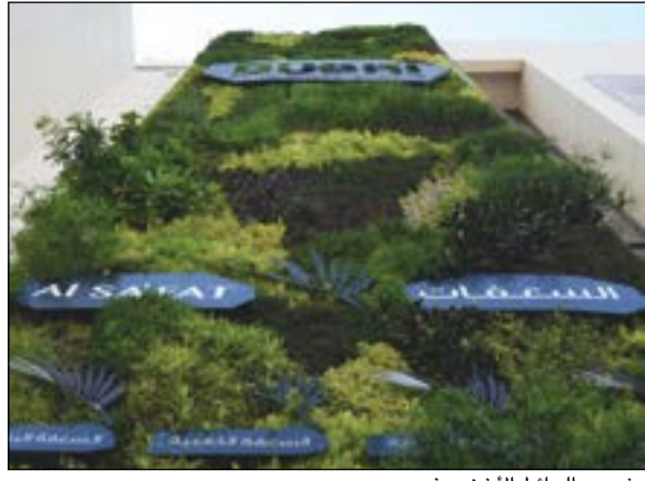
مشروع الحائط الأخضر في دبي